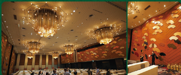
6月会場下見様子。幻想的な照明色がきれいな空間でした。当日にお会いしましょう!