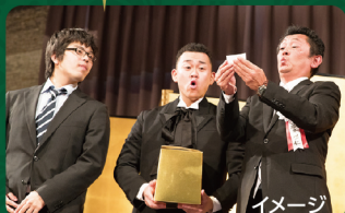
恒例のくじ引きもやります!