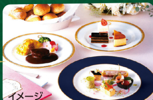
料理長の腕が奮う食事コース